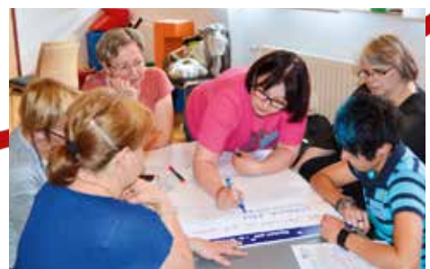
Fortbildungsangebot für Fachkräfte