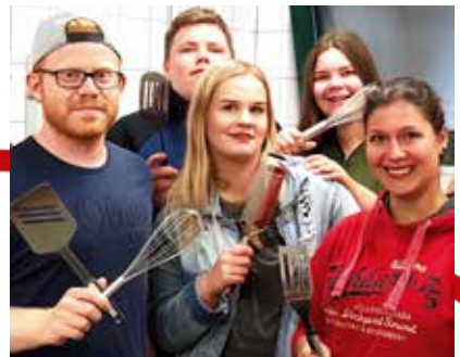
Freiwilligendienst Pädagogische Begleitung