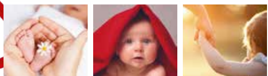
Frühe Hilfen für junge Familien Willkommensbesuche, wellcome, FamilienPaten